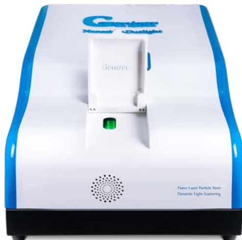
Analyseur de taille de nanoparticules à double laser