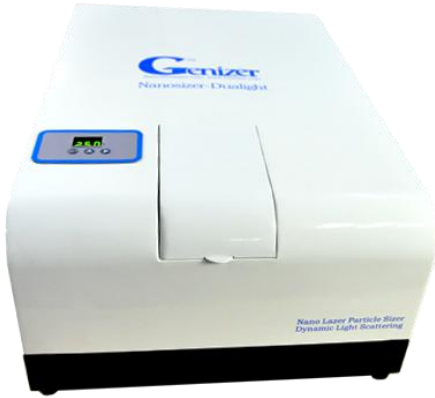
듀얼 레이저 나노 입자 크기 분석기